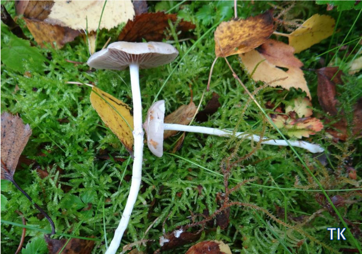
Abb. 1: Purpurgrauer Träuschling ( Stropharia inuncta )